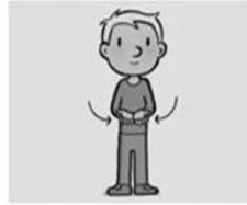
Geef ons heden ons dagelijks brood