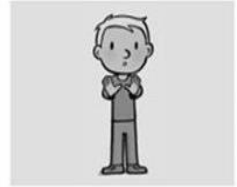
en breng ons niet in beproeving