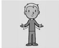
Uw rijk kome