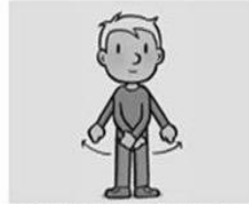
maar verlos ons van het kwade