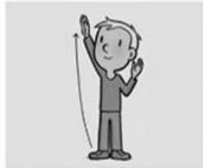
zoals in de hemel.