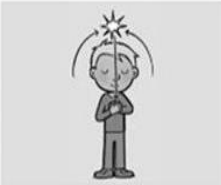
Uw naam worde geheiligd