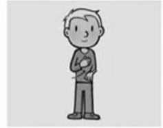
en vergeef ons onze schulden