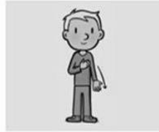
zoals ook wij vergeven aan onze schuldenaren