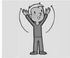
die in de hemel zijt